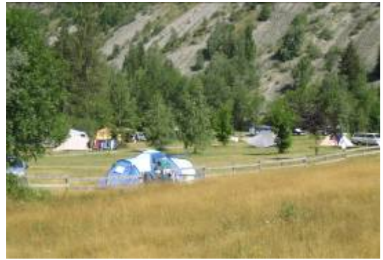
le camping des Faures en Valjouffrey