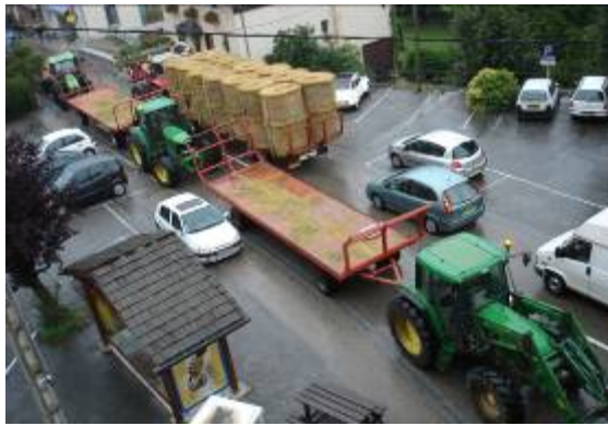
des bouchons agricoles à Valbonnais !!!