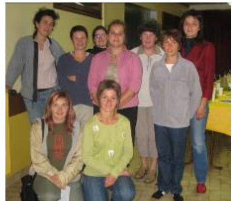
le Sou des écoles de Valbonnais