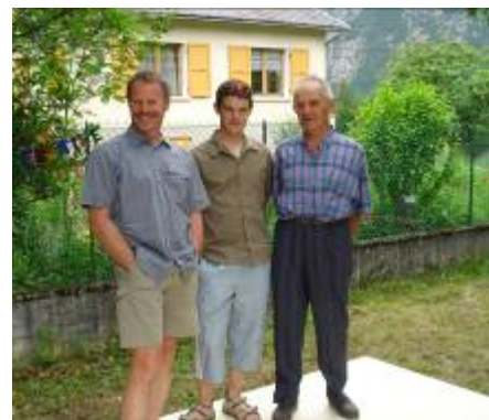
Nicolas Bonnet (au centre) : le champion du monde espoirs...