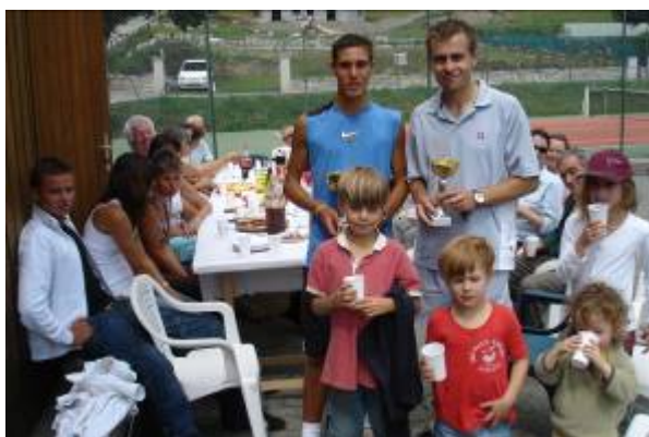
La victoire d'un vacancier du Valjouffrey au tournoi de tennis de Valbonnais...