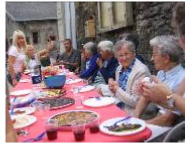
1 er septembre : fête des Engelas les tartes et pognes cuites au four : c'est pas banal !