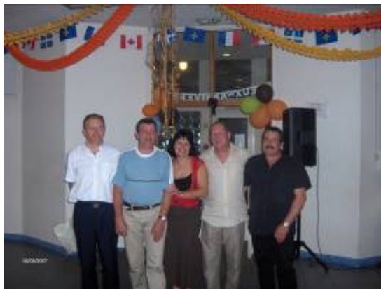
Conscrits des Engelas ...en fête !!!