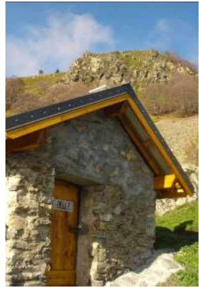
La cabane de Côte Belle et son enclos de pierres sèches...