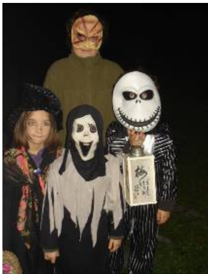
octobre 2010 : Halloween