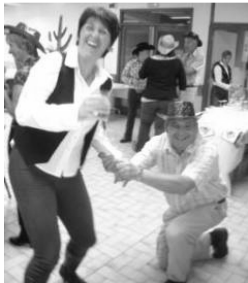
Octobre 2010 : soirée country