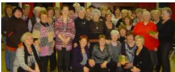
S te Agathe 2011