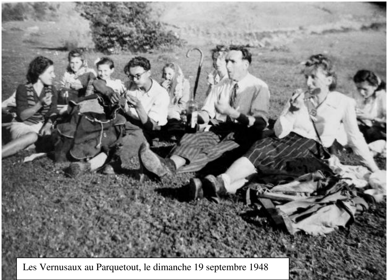
Les Vernusaux au Parquetout, le dimanche 19 septembre 1948

Au col d'Hurtière, le froid vous saisit, le brouillard vous environne, on découvre en arrivant au Sanctuaire le merveilleux spectacle de la mer de nuages, entre les trouées cotonneuses on entend le son des cloches et le murmure de voix toutes proches, parfois il suffit d'un bref coup de vent pour que tout se dissipe. Je suis redescendue de la Salette avec la menace de l'orage, il finissait toujours par éclater, il ne fallait pas courir pour ne pas attirer la foudre, le grondement du tonnerre dans la montagne a quelque chose de terrifiant, on finissait par arriver, harassés, trempés, heureux ... Le plus beau spectacle est certainement la messe de minuit à la Salette, avec la montée par la route, entre deux pans de neige, le paysage immaculé, la douceur de l'église, et nos deux bergers encapuchonnés de blanc ».