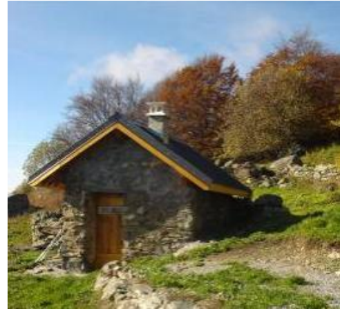
La cabane de Belle Roche a la cote...Belle !