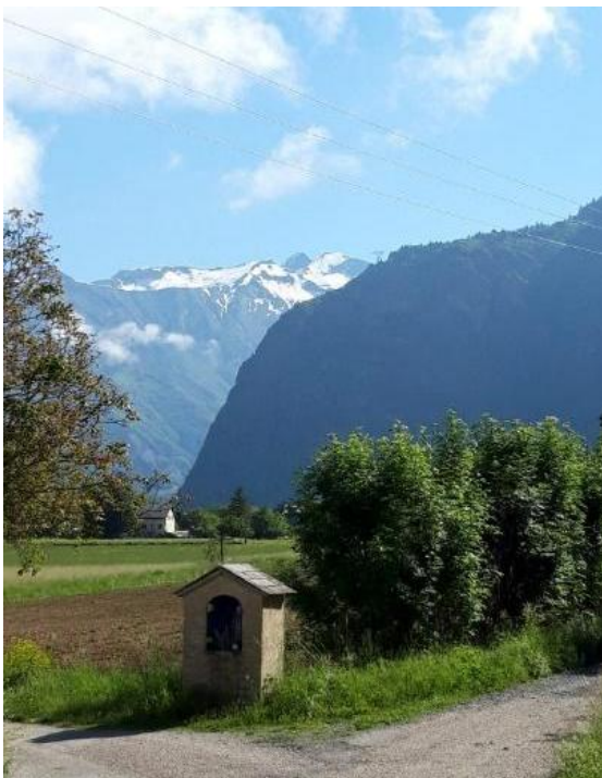
L'oratoire du Templou.