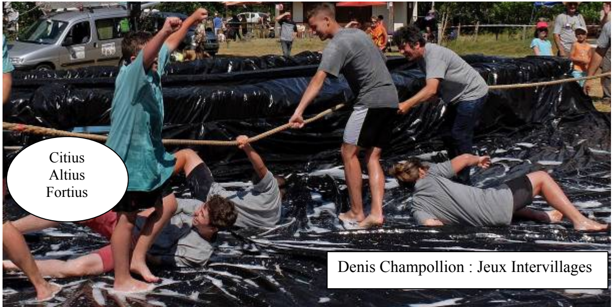
Citius Altius Fortius