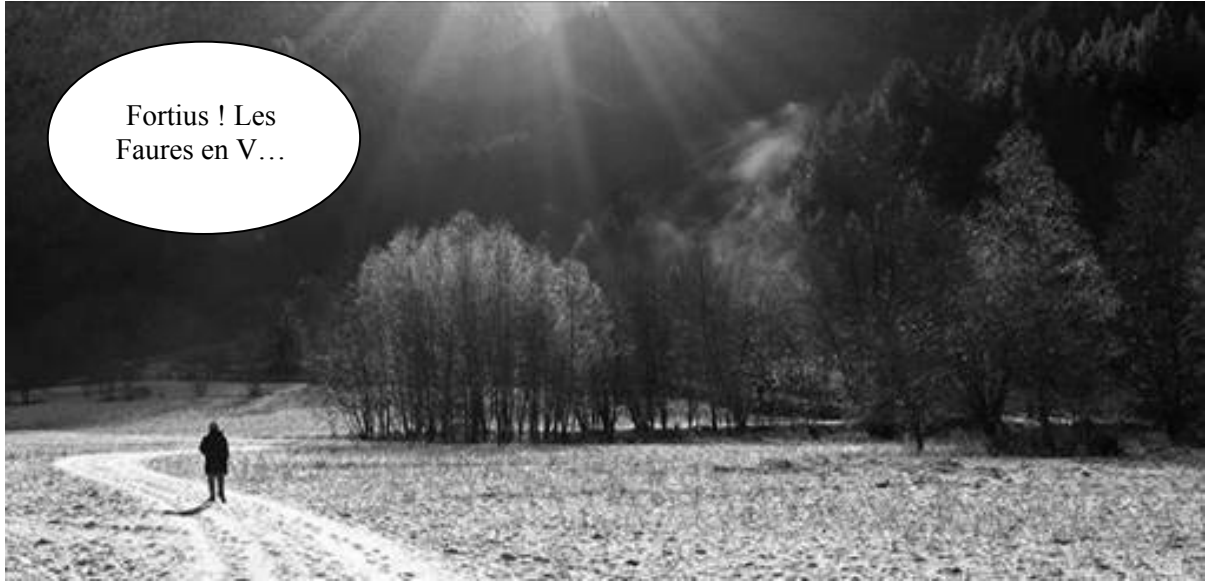
Fortius ! Les Faures en V...