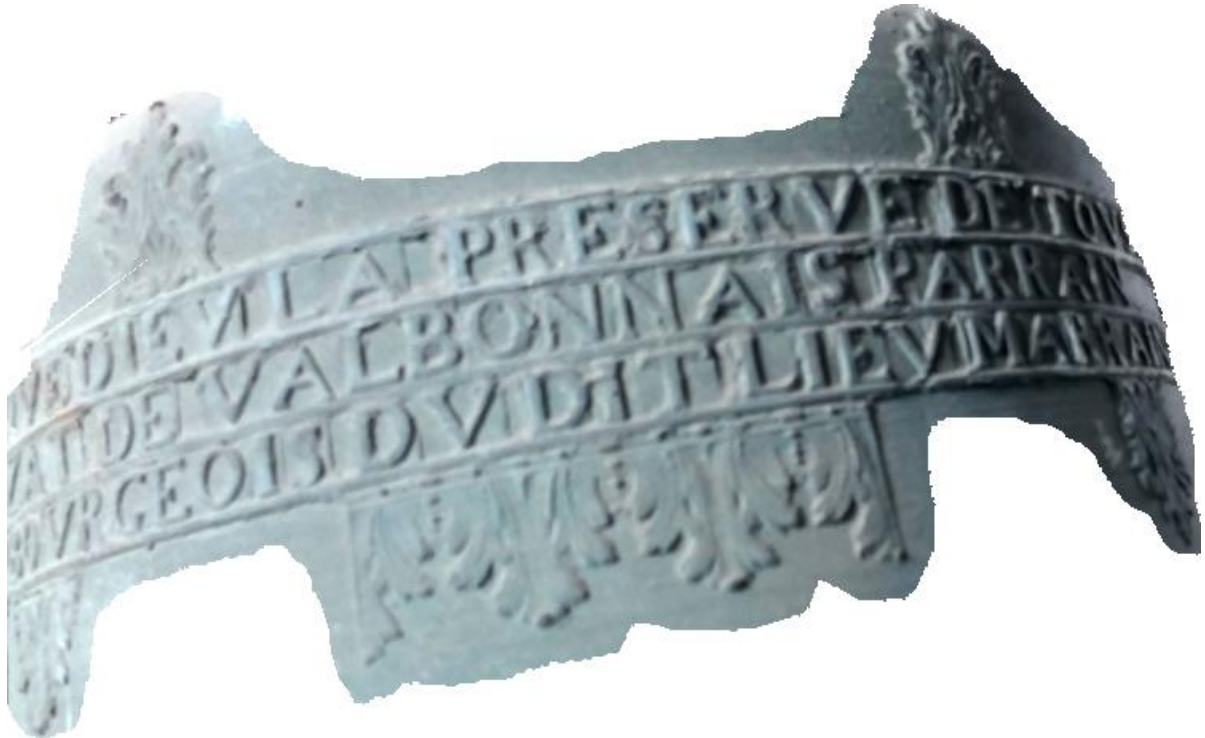
Sous le Crucifix : VALLIER — FECIT — ( marque de Soyer ) 1757 Note : la. Diam. 86 c.